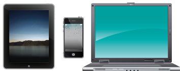
Skanowanie bezpośrednio do komputera lub urządzeń mobilnych