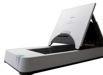
A4 Flatbed Scanner Unit 101