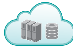
Udostępnianie w aplikacjach / obiegu dokumentów w chmurze